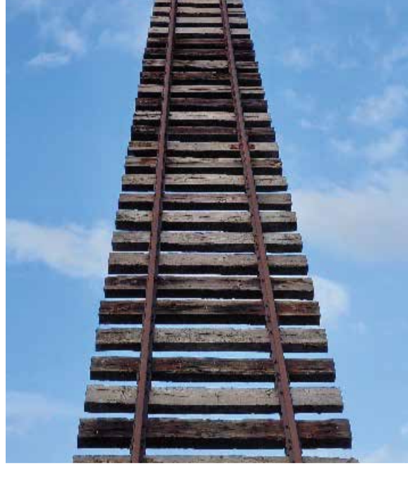
Kapija koja nikuda ne vodi, sponenik žrtvama holokausta

Učesnici su bili nastavnici i edukatori u neformalnom obrazovanju, muzejski i arhivski radnici i zaposleni u nevladinom sektoru iz 11 zemalja: Finske, Hrvatske, Slovenije, Grčke, Italije, Francuske, Nemačke, Mađarske, Poljske, Češke i Srbije. Fokus seminara bila je Češka perspektiva holokausta i posleratnog perioda komunizma.