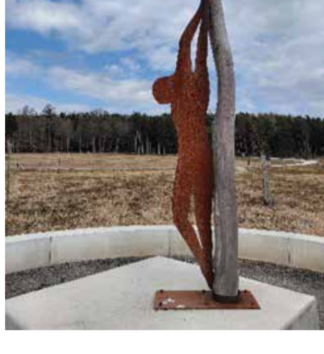
Leti, sponenik u memorijalnom kompleksu posvećenom romskim žrtvama